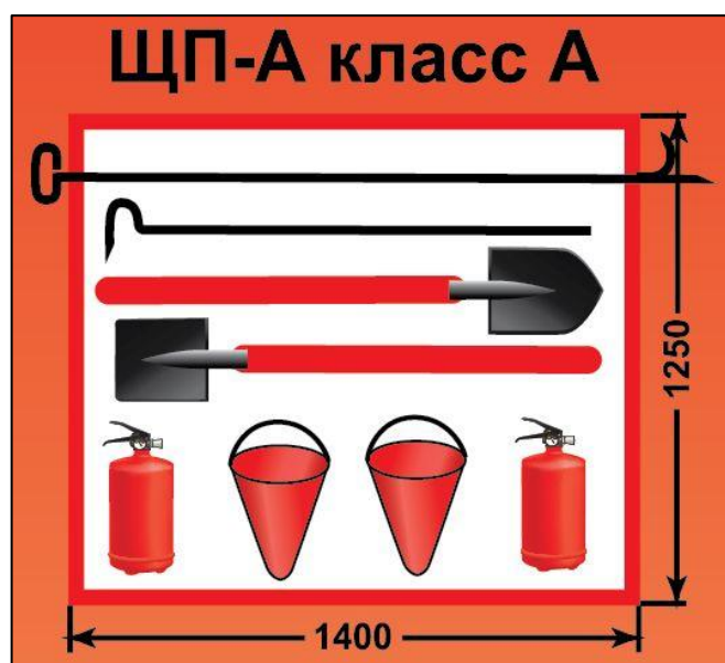
ЩП-А – щит пожарный для очагов пожара класса А