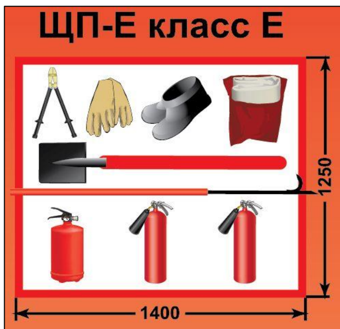
ЩП-Е – щит пожарный для очагов пожара класса Е