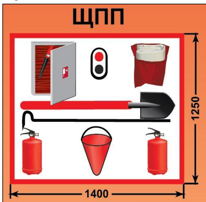
ЩПП – щит пожарный передвижной