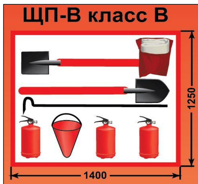
ЩП-В – щит пожарный для очагов пожара класса В